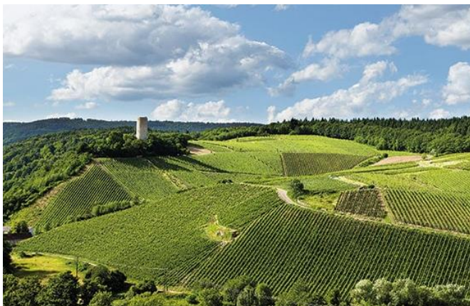
Weingut Robert Weil, Kiedricher Turmberg (links) und Kiedricher Gräfenberg (rechts)