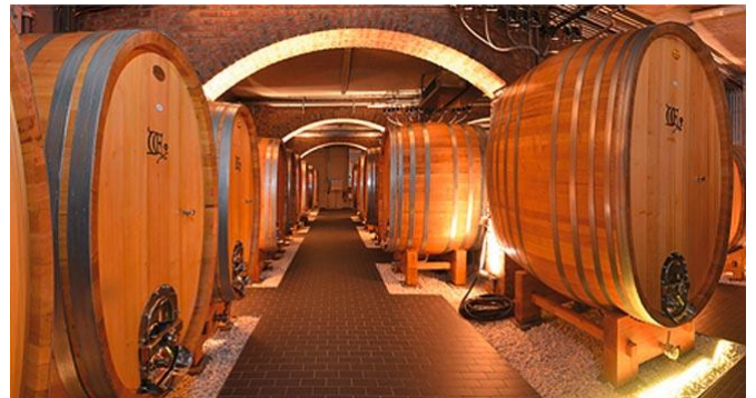
Weingut Robert Weil, der Doppelstückfass-Keller