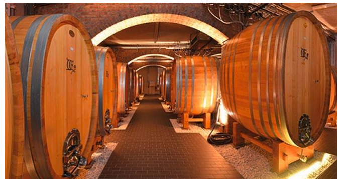
Weingut Robert Weil, der Doppelstückfass-Keller