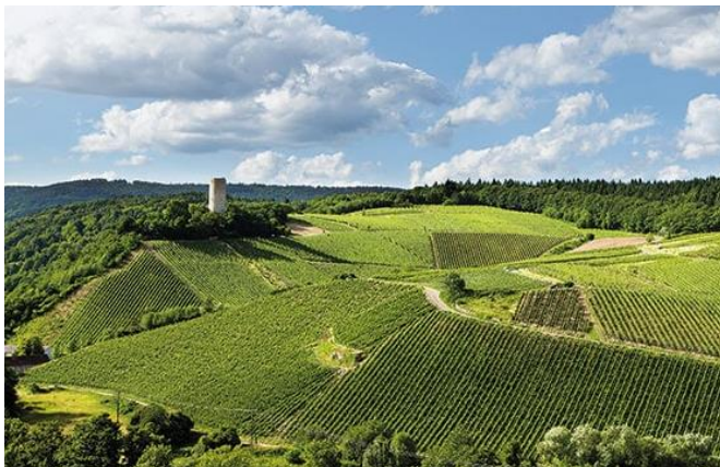
Weingut Robert Weil, Kiedricher Turmberg (links) und Kiedricher Gräfenberg (rechts)