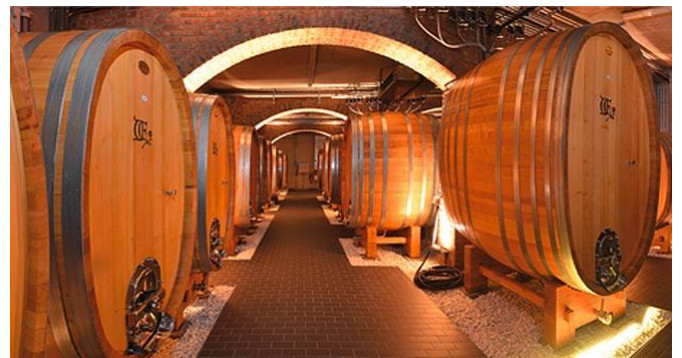
Weingut Robert Weil, der Doppelstückfass-Keller