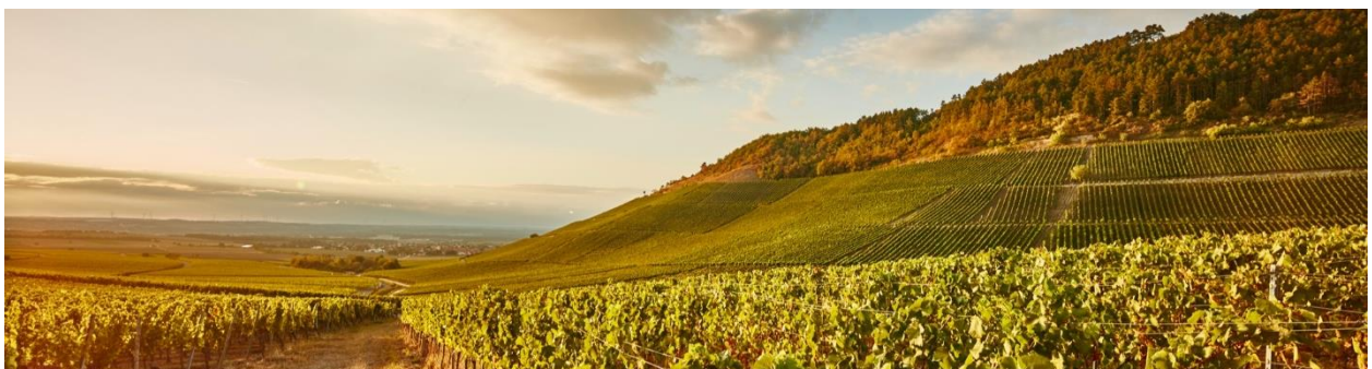
Der Iphöfer Julius-Echter-Berg. Eine der renommiertesten Lagen Frankens.