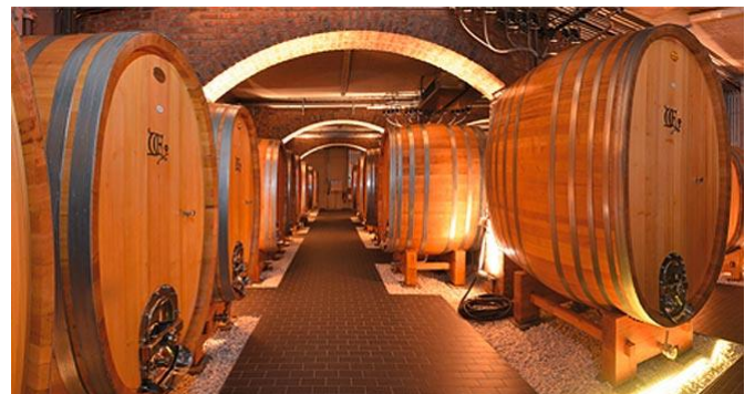
Weingut Robert Weil, der Doppelstückfass-Keller